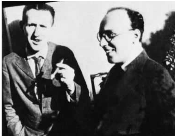
Bertolt Brecht und Kurt Weill

eine erste Version von Furcht und Elend des dritten Reiches an.